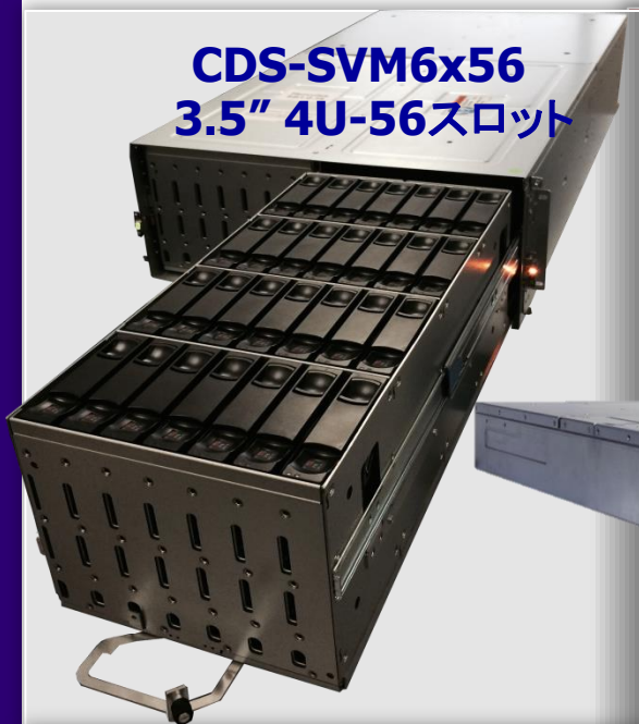
CDS-SVM6x56 3.5" 4U-56スロット

高機能Real-Time階層化機能システムを更に高速、大容量化 - クラス最高峰のパフォーマンス