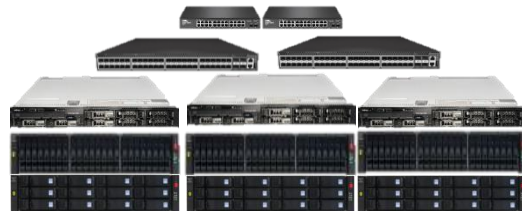
SVM9000 Head部 +ネットワーク